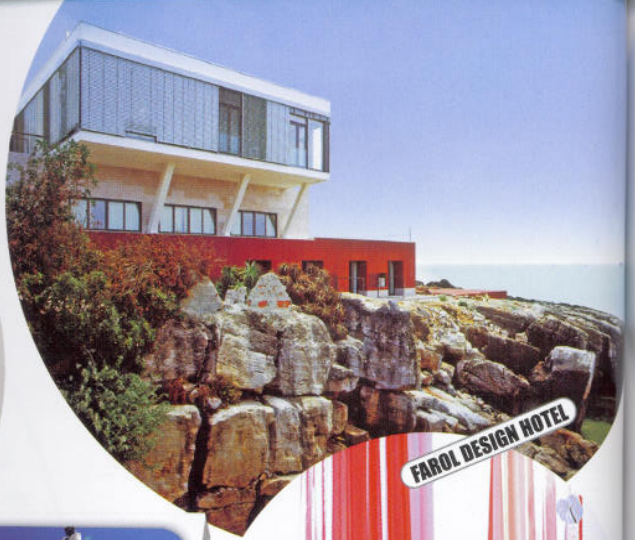
FAROL DESIGN HOTEL