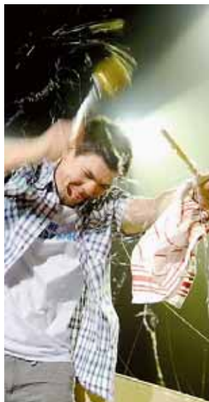
Mal spektakulär, mal klassisch: TV-Promi-Koch Tim Mälzer weiss sein Publikum mit Bier und spannenden Rezepten bei Laune zu halten.

cken. Die Show des VOX-Aushängeschilds ist zum Glück um einiges anmächlicher. Während fast vier Stunden brutzelt, schnippelt, backt und flambiert Mälzer verblüffend einfache Gerichte. In sein Programm baut er immer regionale Spezialitäten ein – nicht nur kulinarische, sondern auch lokale Berühmtheiten. In Basel